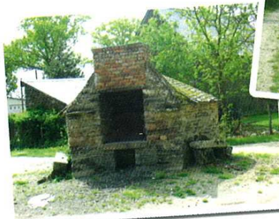
Four le Pré

Muni de jumelles, petite pause pour admirer au détour d'une fenêtre paysagère le marais de Gannedel. À peine arrivé, premier face à face avec Saint Melaine, évêque de Rennes, représenté sur le tympan de l'église. Tous en file indienne pour suivre ce petit sentier qui court à travers les prairies.