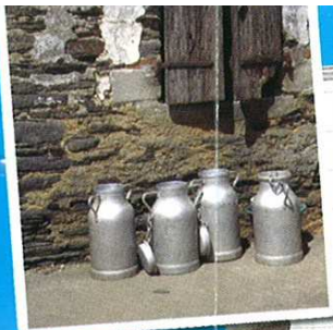
Habitat traditionnel à Gannedel

À 15 km, au nord-est de Redon. Suivre la D 177 direction Rennes, puis la D 56 et D 256.