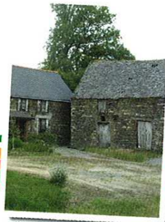
Village de Cranet