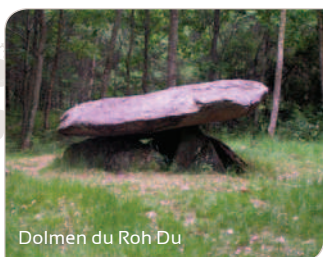
Dolmen du Roh Du