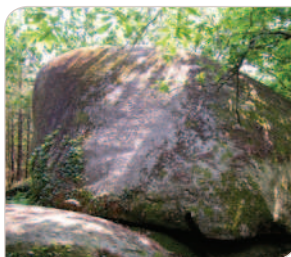
Rocher de Kervadail.