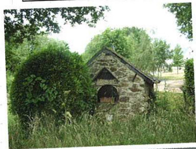
Four à pain de Landron