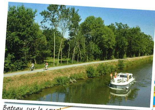
Bateau sur le canal