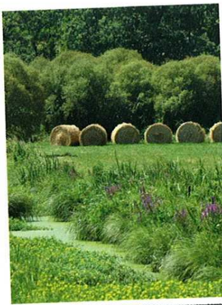
Autour du canal