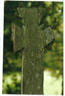
Croix près de la chapelle Saint-Méen