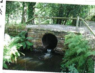
Pont de la Barbotte

Au niveau du ruisseau et près de la passerelle, en un clin d'œil vous passez de Théhillac à Sévérac, du Morbihan en Loire Atlantique, et de la Bretagne en Pays de Loire!