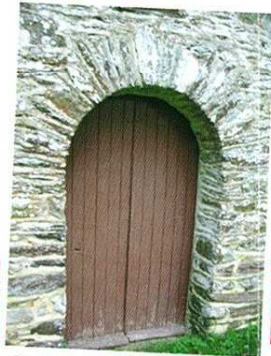
Porte de la chapelle de Joie