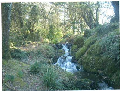
Cascade au moulin de Quip