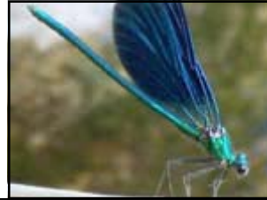
Une demoiselle bleue